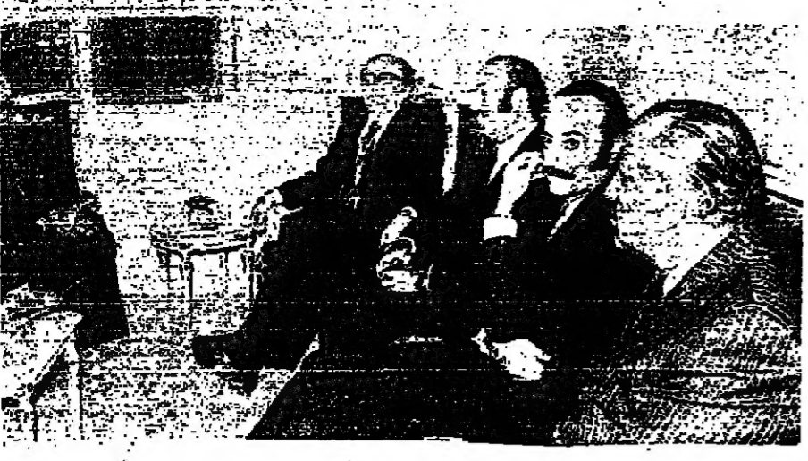
وزيرة سماحة الامام الصدر